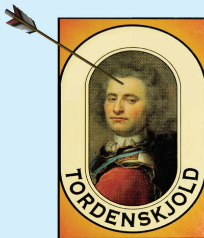
Fig. Tordenskjolds soldater er et udtryk som oprindeligt stammer fra historien om Tordenskjold, der i forbindelse med slaget ved Carlsten fæstning i Marstrand i Sverige, lod sine få besætningsmedlemmer og soldater marchere i ring i byen, således det så ud som om han havde flere soldater, end han rådede over. Lokalrådet vil gerne have flere nye soldater så de samme ikke behøver at gå i ring.

Lokalrådet har valgt at arbejde videre med flere af de valgte idéer på samme tid i stedet for blot at fokusere på enkelte. Da flere af idéerne omhand-