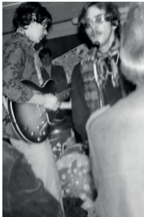
Steppeulvene live i kælderen under Engum skole

I dagene efter var det ikke sjovt, hvis man ikke havde deltaget. Der blev brugt rigtig meget tid på "evaluering" af musikken, kærester, påklædning og meget andet.