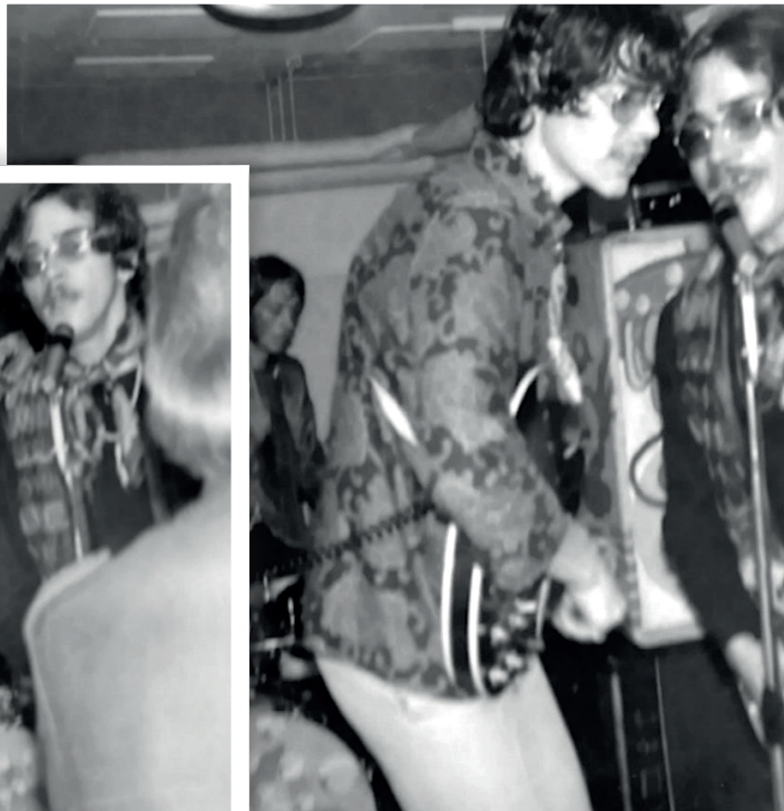
Foto og materiale: Paul Lundager Andersen, tidligere bestyrelsesmedlem "Bongo Klub"