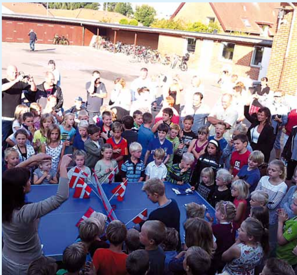
Indvielse af bordtennisborde

I skrivende stund venter Torvedagen den 20. september, hvor eleverne i indskolingstraditionen tro medbringer alle mulige former for frugt og masser af blomster mm., så vi alle kan gå rundt og "shoppe sundt" med papirpengefremstillet til dagen. Dagen indledes med en lille skolekoncert, idet vi får besøg af "Gospel Sisters", der kommer her som led i det landsomfattende skolekoncertprogram "LMS - Levende Musik i Skolen"