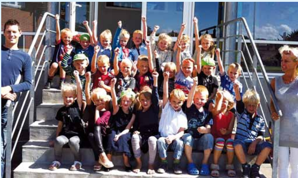
0. klasse på Engum Skole 2012-13

Menighedsrådet ved Engum Kirke havde brug for hjælp.....og hvad det nu gik ud på, kan man læse andet steds i Sognebladet.