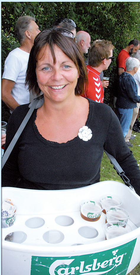
Ølpigerne var populære under kampen og med til at skabe et solidt overskud på arrangementet