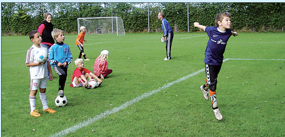
Fuld koncentration til teknikmærkedagen.

Fodboldskolen forløb også planmæssigt. Vi var igen heldige med vejret, selv om det indimellem var lidt for varmt. Tak til alle instruktører og forhåbentlig på gensyn i uge 26 i 2010.