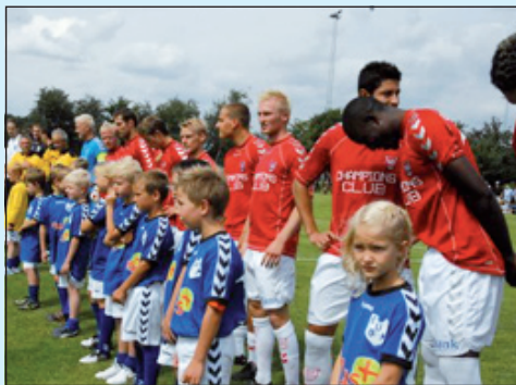
VB og FC Fredericia kom på banen sammen med Engum-maskotter.