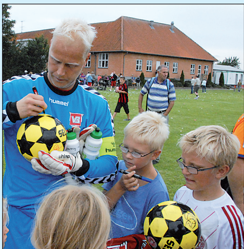
VB-målmand havde travlt med at skrive autografer til mange små fans.