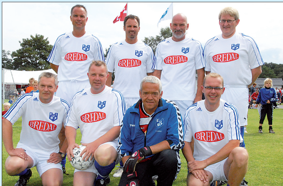
Engums hold, der vandt forkampen 5-3 mod "Byrødderne".