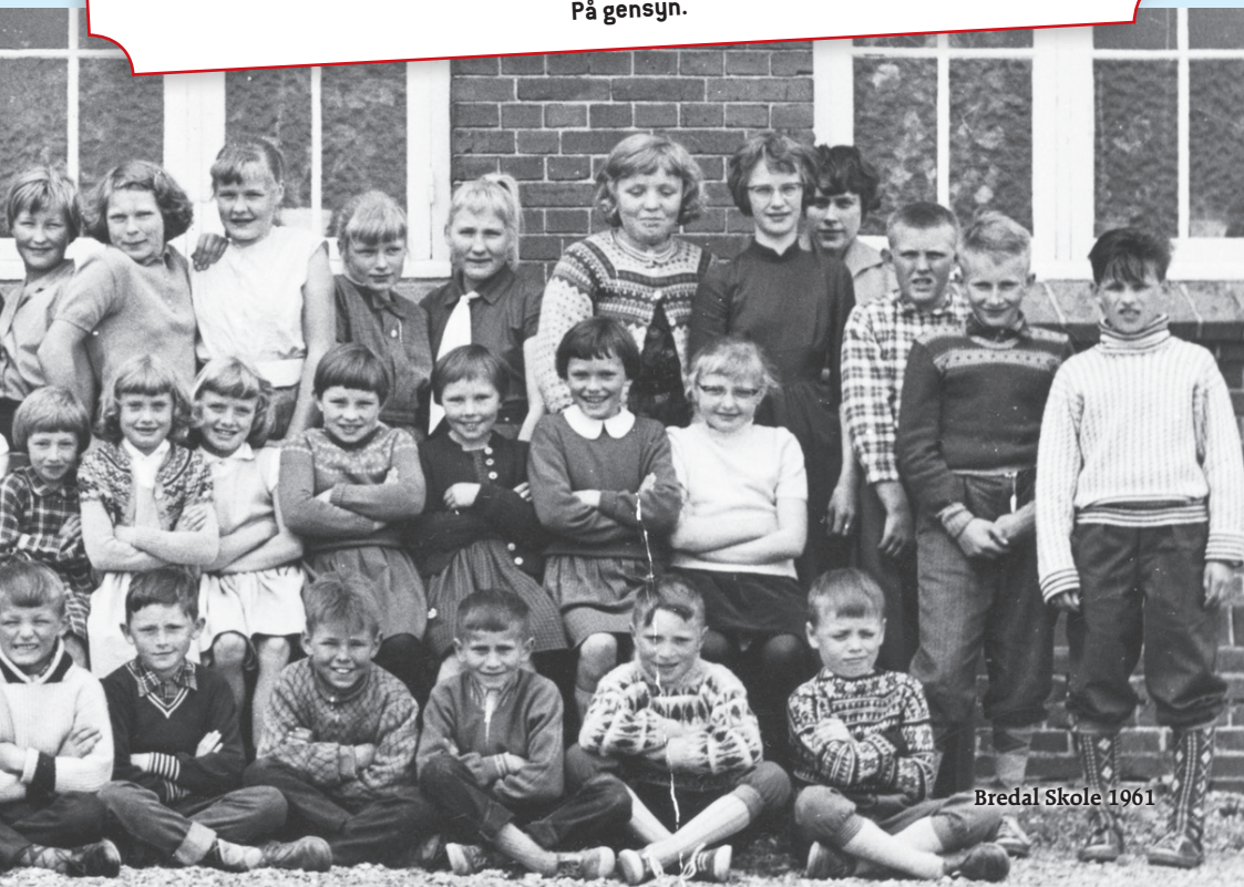
Bredal Skole 1961