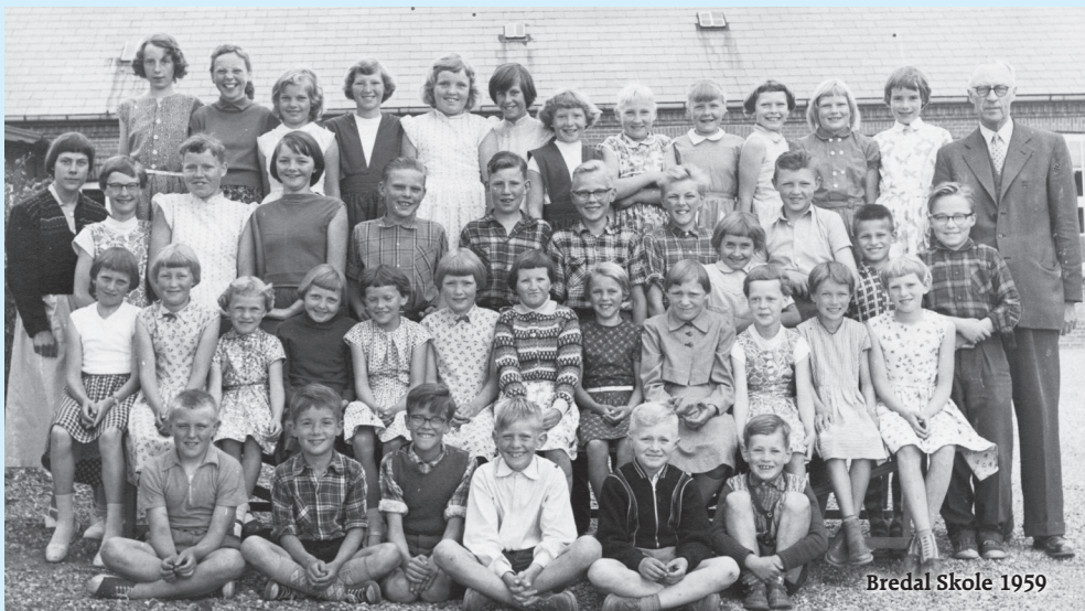
Bredal Skole 1959