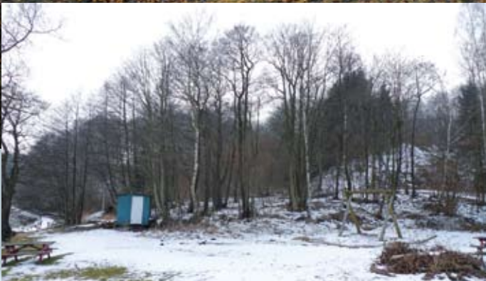
Bålpladsen ved Ulbækhus før (lille foto) og efter...